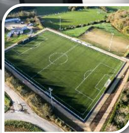
Vie municipale // 10 Terrain de football en gazon synthétique