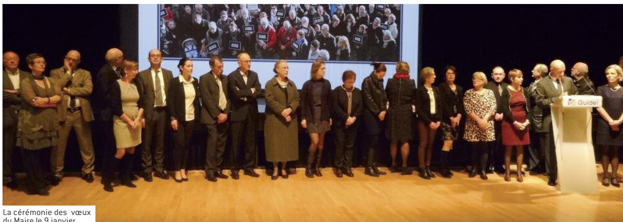
La cérémonie des vœux du Maire le 9 janvier