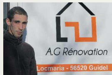
TOUS TRAVAUX A.G. Rénovation

Contact : 06 37 71 95 69 / 02 97 80 89 33