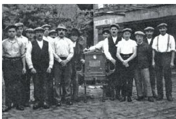
En 1935, la motopompe Drouville était entreposée au Domaine de Kerbastic.

Ils portent le même prénom et ont partagé le même engagement au service et au secours de l'autre.