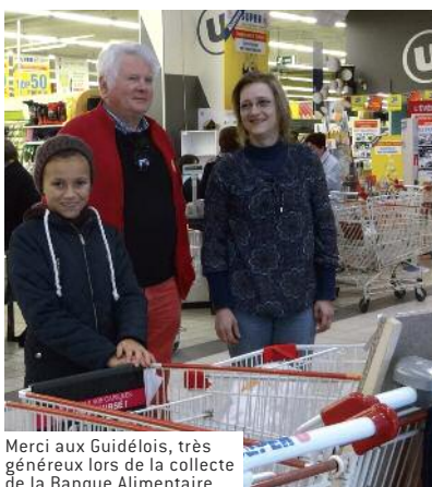
Merci aux Guidélois, très généreux lors de la collecte de la Banque Alimentaire