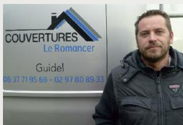
COUVERTURES Le Romancer

Contact : 02 97 81 27 44 / 06 08 08 99 13 5D Place Jaffré