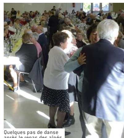
Quelques pas de danse après le repas des aînés