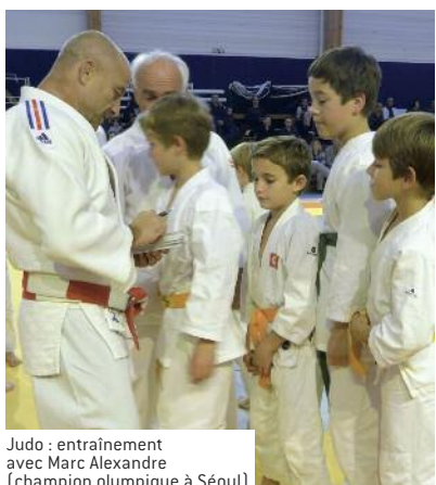
Judo : entraînement avec Marc Alexandre (champion olympique à Séoul)