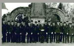
Les pompiers volontaires avec le sénateur maire Louis Le Montagner