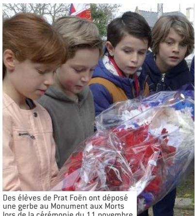
Des élèves de Prat Foën ont déposé une gerbe au Monument aux Morts lors de la cérémonie du 11 novembre