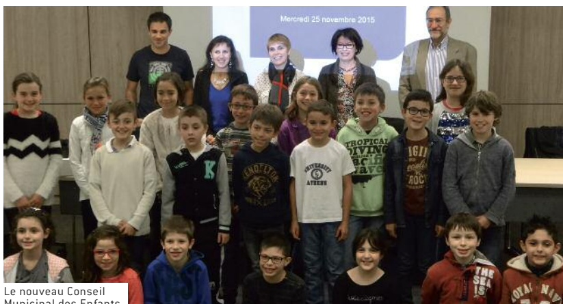
Le nouveau Conseil Municipal des Enfants