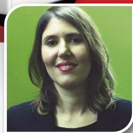
Culture // 13 L'ESTRAN à la découverte des arts