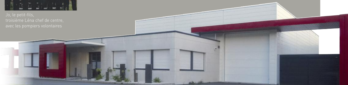
Le futur centre d'incendie et de secours aux 5 Chemins

“ Une page de l'histoire du centre se tourne mais mon frère Louis est encore présent pour plusieurs années. ”