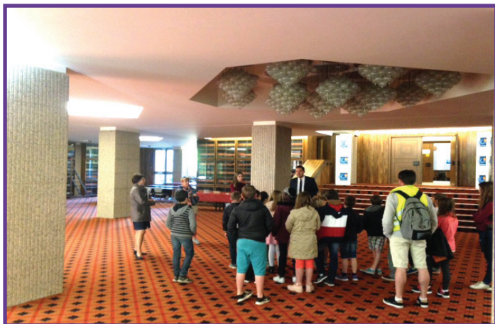
Hall d'accueil du Conseil Départemental

Nous nous sommes rendus dans l'hémicycle du Conseil départemental, qui est une grande pièce en forme de demi-lune où siègent les 42 élus départementaux. Là nous avons pu apprendre beaucoup de choses notamment concernant les missions d'un élu départemental.