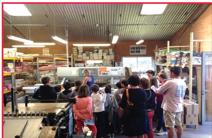
Durant l'explication des machines de l'imprimerie