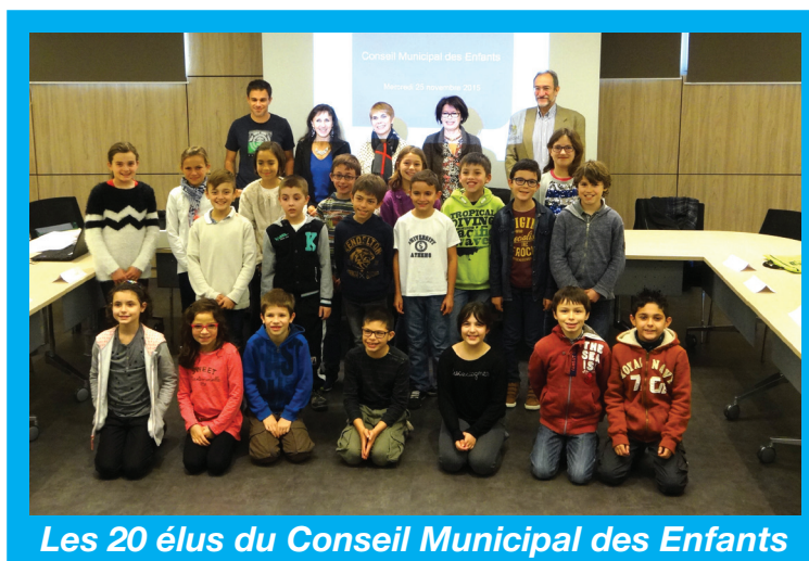
Les 20 élus du Conseil Municipal des Enfants

Ces jeunes élus ont été répartis en 3 groupes de travail, appelés des « commissions ».