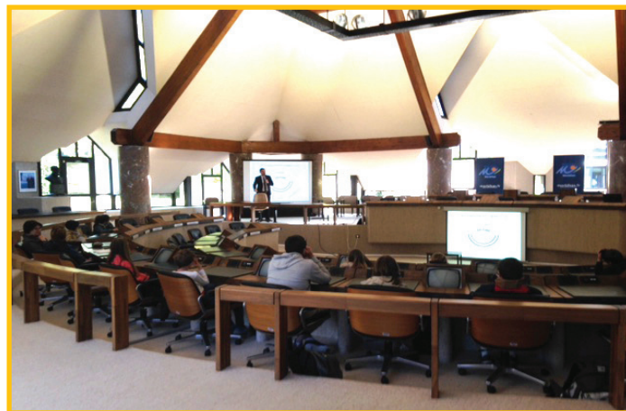
Hémicycle du Conseil Départemental

Après avoir visité le Conseil Départemental, nous nous sommes rendus à Arradon pour visiter une imprimerie où nous avons pu découvrir les ateliers d'impression.