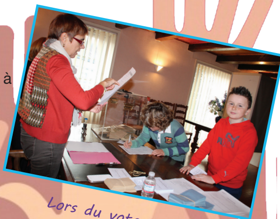
Lors du vote en 2015

La prochaine élection du Conseil Municipal des Enfants aura lieu en Octobre 2017 pour une période de deux ans. D'ici là prépare ton programme pour défendre tes idées et deviens candidat !