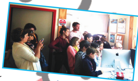
Avec les graphistes

Nous sommes tous très contents de cette visite car c'était super bien d'apprendre tant de nouvelles choses.