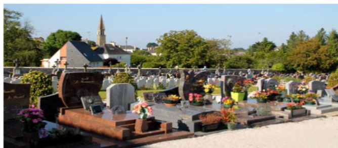
Cimetière de Guidel - Emplacements des concessions funéraires